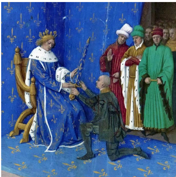
Bertrand Du Guesclin fait connétable par le roi Charles V