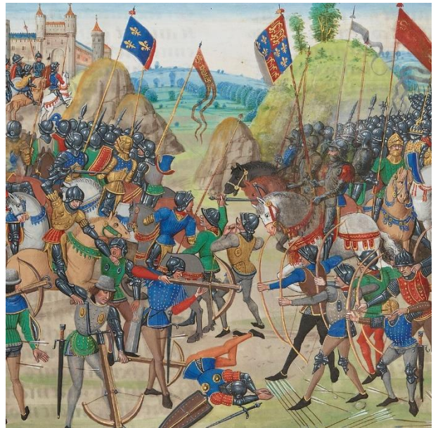
Bataille de Crécy

En 1337, Édouard III, roi d'Angleterre, qui possédait de vastes terres en France et revendiquait le trône français, déclara la guerre à la France. Les Anglais envahirent le nord-ouest du pays. Ils remportèrent des victoires à Crécy en 1346 et à Poitiers en 1356. Les Français furent contraints de signer le traité de Brétigny en 1360, cédant le sud-ouest de la France aux Anglais.