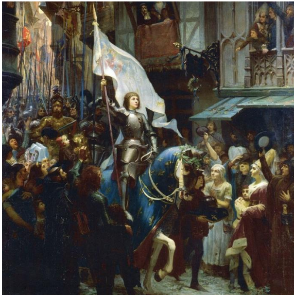
Entrée de Jeanne d'Arc à Orléans