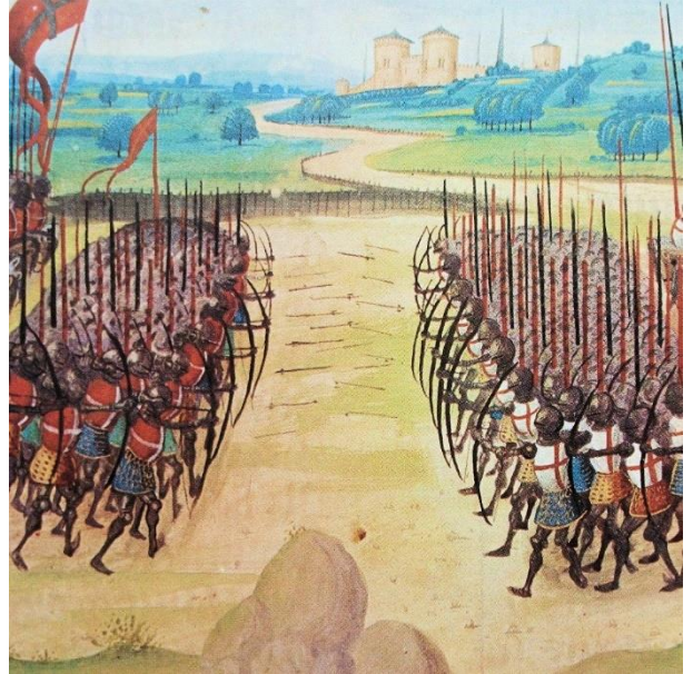
La bataille d'Azincourt

En 1420, le roi Charles VI, affaibli par des crises de folie, déshérita son fils et désigna le roi d'Angleterre comme héritier du trône français par le traité de Troyes. Henri V d'Angleterre remporta la célèbre bataille d'Azincourt en 1415, consolidant la domination anglaise. À la mort de Charles VI, une partie des Français refusa de reconnaître le roi d'Angleterre et soutint Charles VII, fils de Charles VI, menant à une guerre civile dévastatrice.