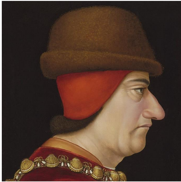
Louis XI (1423-1483)

Avec la paix rétablie, Louis XI poursuivit les réformes commencées par ses prédécesseurs avant la guerre. Il agrandit le domaine royal, notamment en annexant la Bourgogne. Il renforça son autorité en interdisant aux seigneurs de se faire la guerre, en constituant une armée professionnelle et en instaurant des impôts royaux permanents : la taille, la gabelle et les aides. Il créa également un système postal pour que ses ordres puissent atteindre rapidement toutes les régions du royaume. La féodalité touchait à sa fin : désormais, le roi exerçait son autorité sur toute la France.